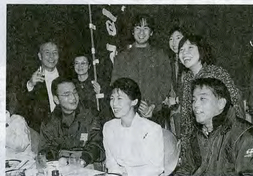
高円宮妃殿下と歓談する山口チーム