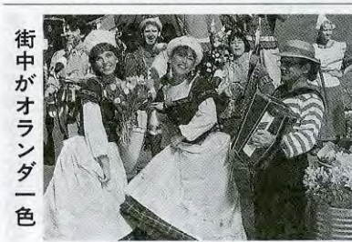
街中がオランダ一色

「静岡」 伊豆半島全域を舞台に「伊豆新世紀創造祭」を展開、観光リゾート地・伊豆が生まれ変わる「伊豆ワカガエル大作戦」(チェンジ伊豆2000!)が始まっています。昨年十二月三十一日〜二〇〇一年一月一日までの足掛