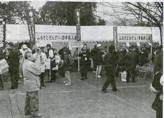
出雲そばやラーメンに長い列