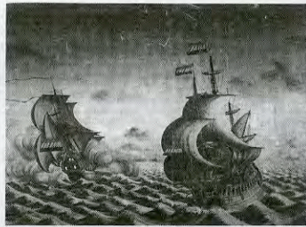
「上」堂本印象作「木華開耶媛」「左」若杉五十八筆「洋船図」今宮神社蔵

くさんの外国文物が、様々な形で人々の生活に入り込んでいました。例えば、京都の夏を彩る「祇園祭」の山鉦の飾り（懸装品）の中には、異国的なデザインの子や陶器、絵画など約200点を展示しており、その美しさと斬新さを楽しむこ