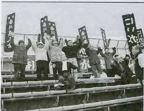
力強い応援の香川県人会