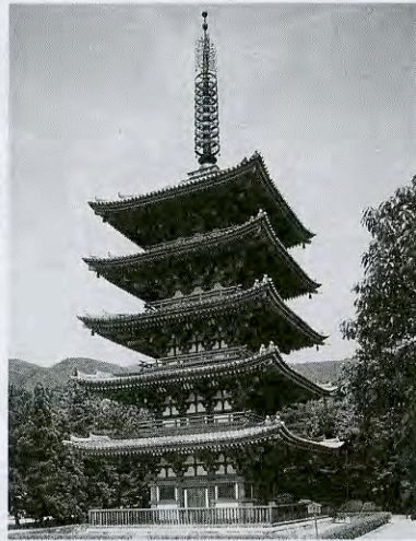
醍醐寺五重塔 (国宝)

今回、世界遺産にも登録されている新緑の醍醐寺では、アイルランドのケルト音楽と踊り・モンゴルの唄と馬頭琴・津軽三味線と津軽民謡・沖縄宮廷舞踊そして新潟県柏崎市に伝わる国重要民俗無形文化財の綾子舞を清龍宮で開催する他、境内各所では、国宝の五重塔等を舞台にして、野外造形展公募「京を創る」を開