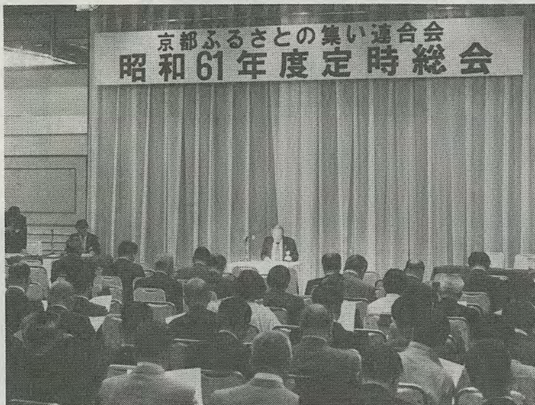
200人が出席して開かれた61年度定時総会