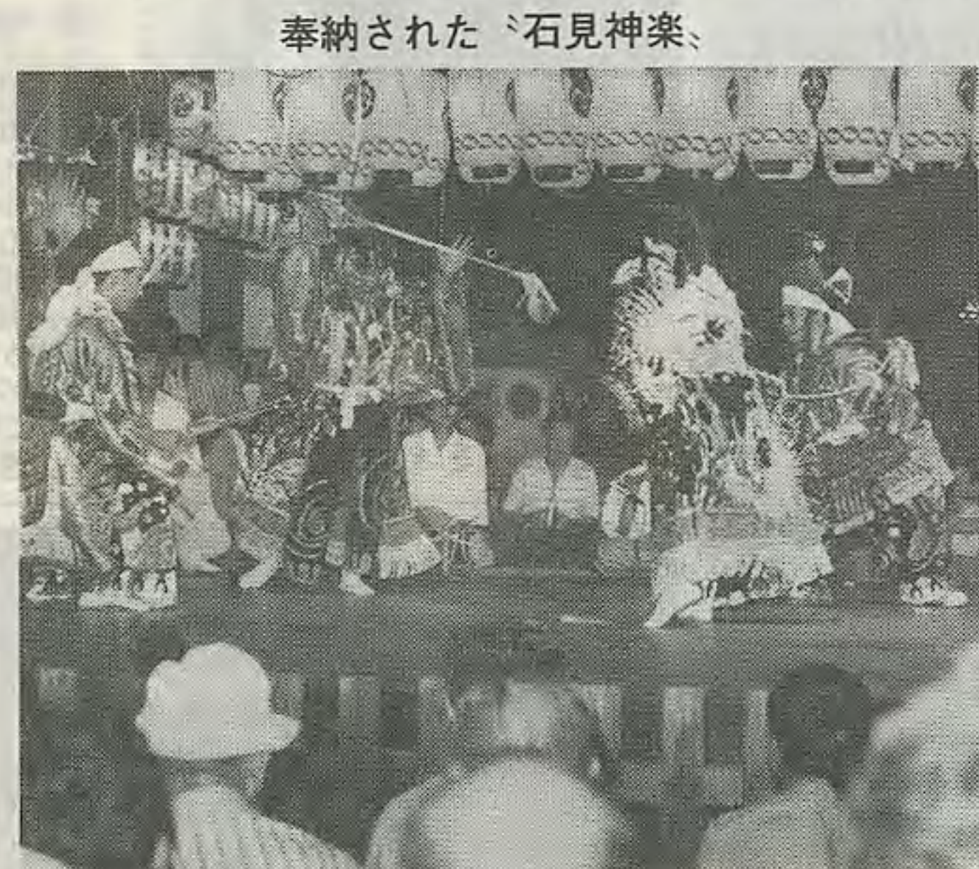
奉納された「石見神楽」