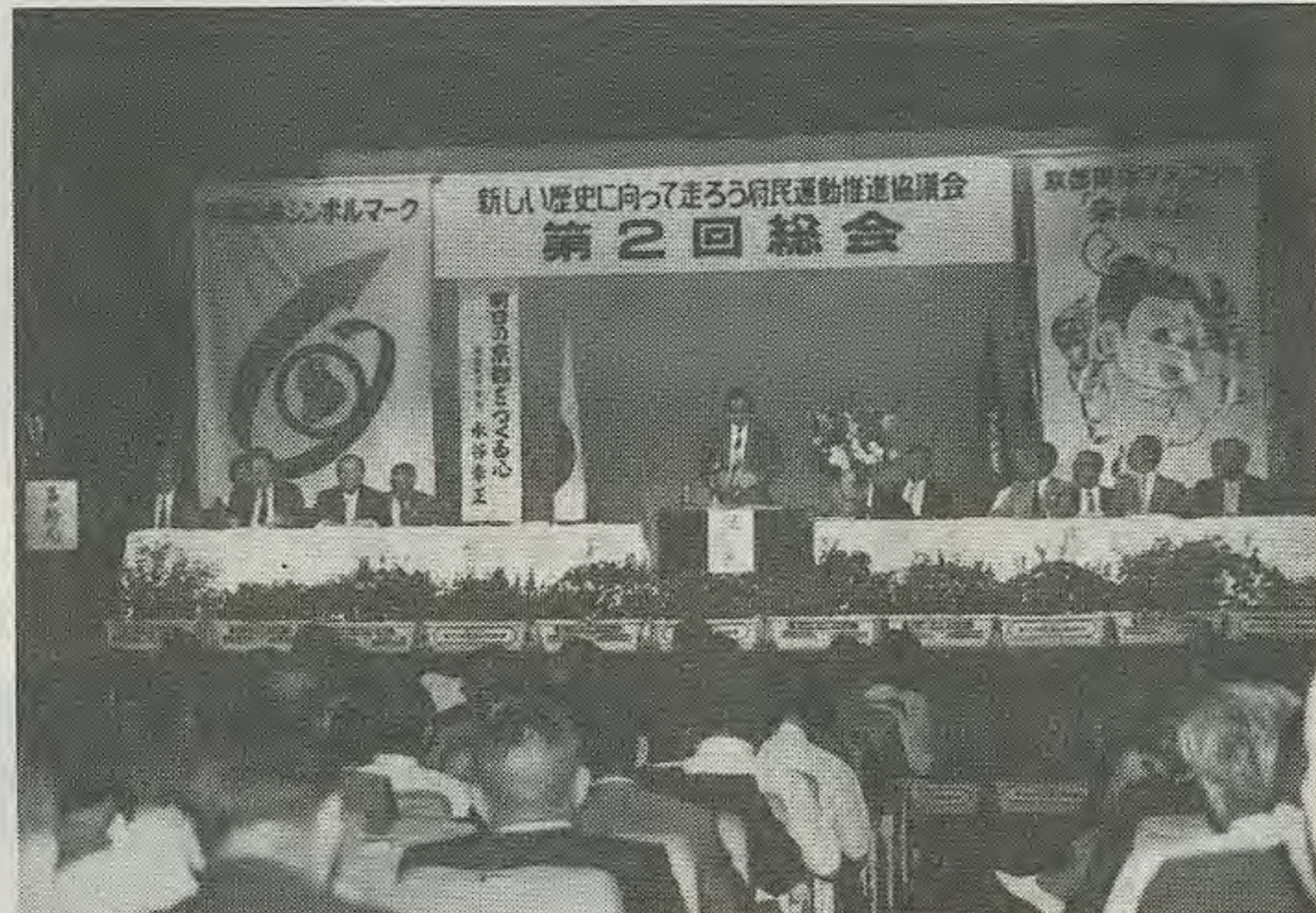
府民運動推進協、第2回総会を開催

ますます強化されてきました。京都国体の成功と明日の京都づくりを目指した府民運動はさらに大きくなるうとしています。