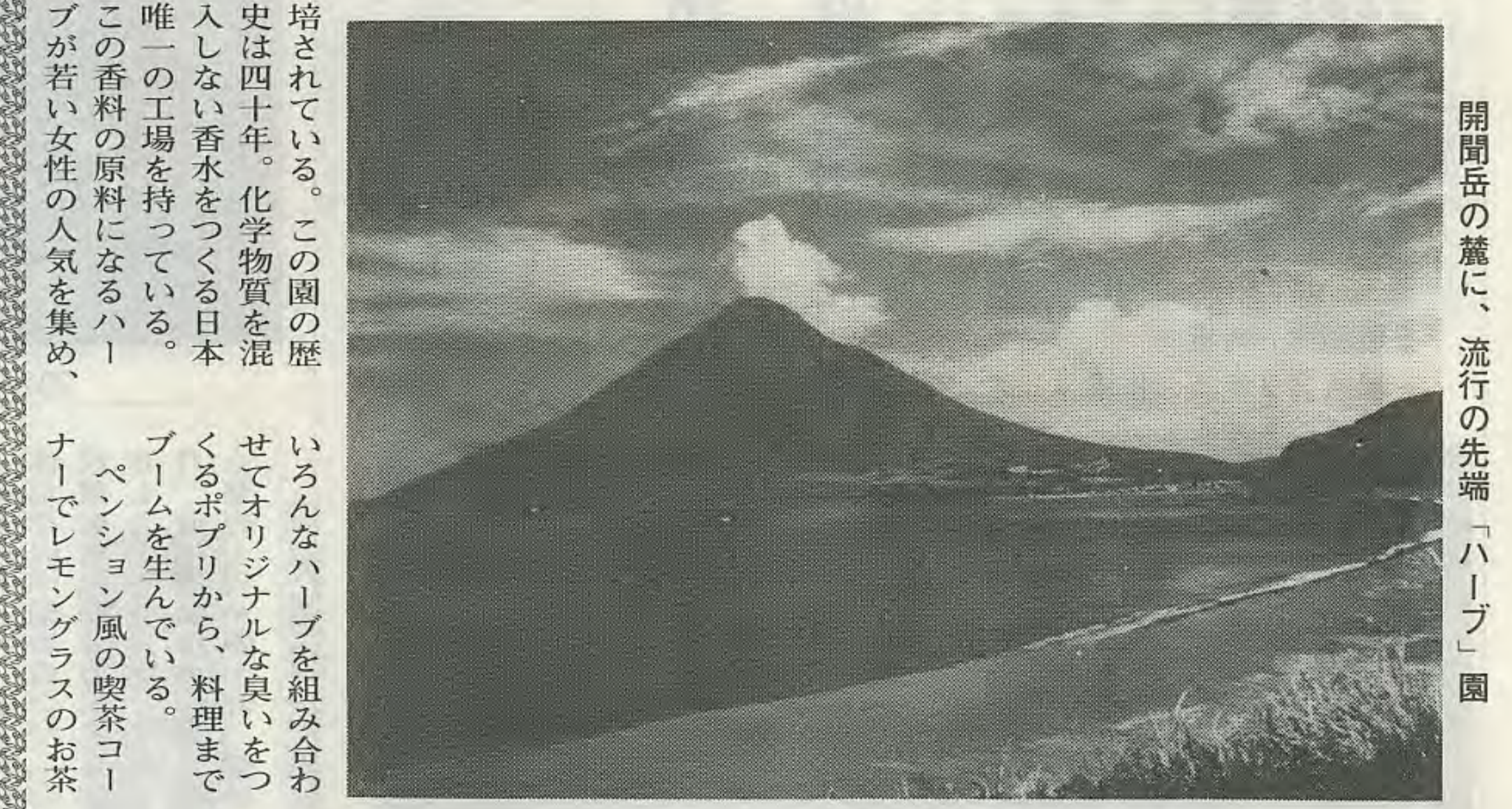
開閉扉の麓に、流行の先端「ハイプ」

指宿を訪れる若い女性が、無人駅の理由から、山川駅に最南端の看板が立つ。カワオ漁港を回つても、彼女らのあとを追ってバスへ乗る。国鉄バスで二十分、見えるのは開閉扉その麓にある香料山HERRGARDEN。が目的の地とわかるまで列車に乗る。西大山がより南になるが、無人駅の理由から、山川駅に最南端の看板が立つ。カワオ漁港を回つても、彼女らのあとを追ってバスへ乗る。国鉄バスで二十分、見えるのは開閉扉その麓にある香料山HERRGARDEN。が目的の地とわかるまで列車に乗る。