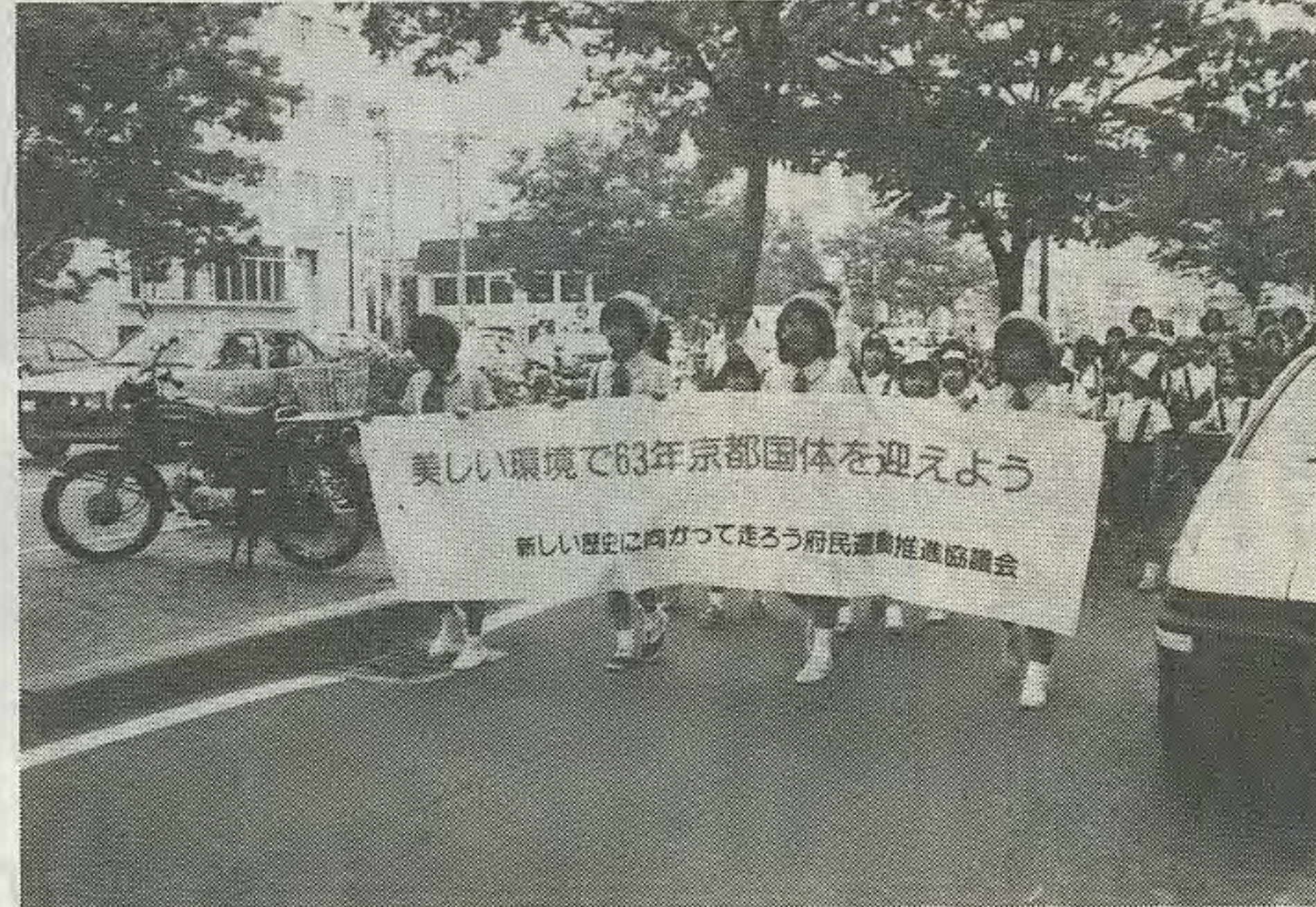
美しい環境で京都国体を……とガールスカウトらが市内をパレード