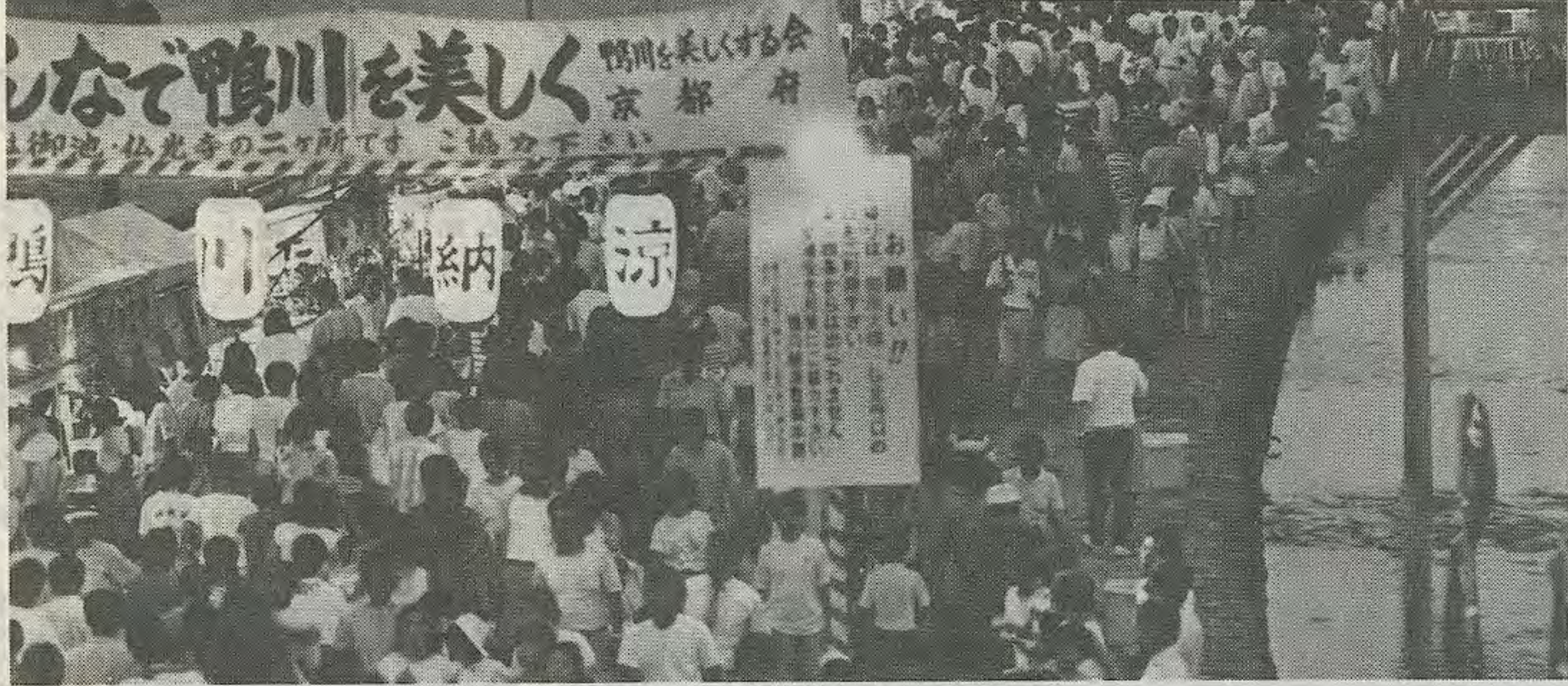
二年ぶりに復活する鴨川納涼

鴨川納涼 日時 8月9・10日 場所 鴨川西岸河川敷 (午後6時~10時) (御池大橋~三条大橋間)