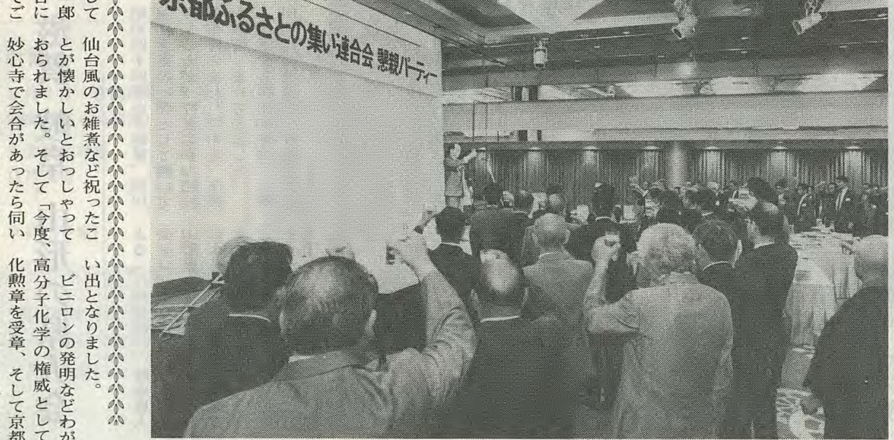
「ふるさと連」の発展を願って乾杯