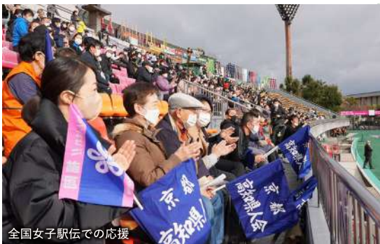
全国女子駅伝での応援