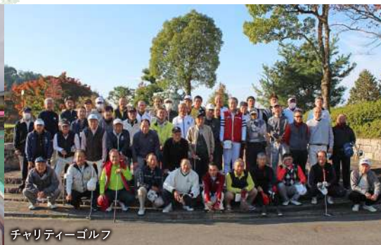
チャリティーゴルフ