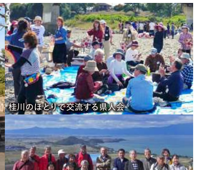
桂川のほとりで交流する県人会