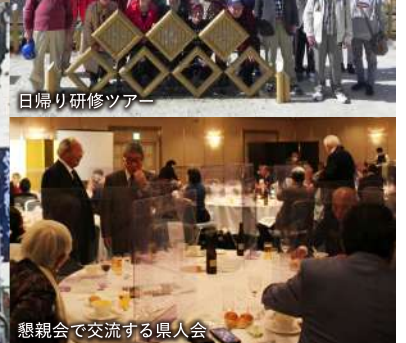
日帰り研修ツアー